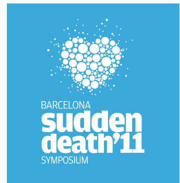
Cartel Simposio sobre muerte s bita