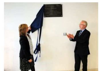
La Consejera de Justicia descubre la placa conmemorativa