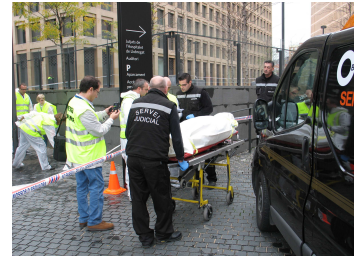
Simulacro en la Ciudad de la Justicia de Barcelona y l'Hospitalet de Llobregat