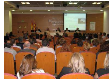
Acto inaugural de las XI Jornadas Catalanas de Actualización en Medicina Forense